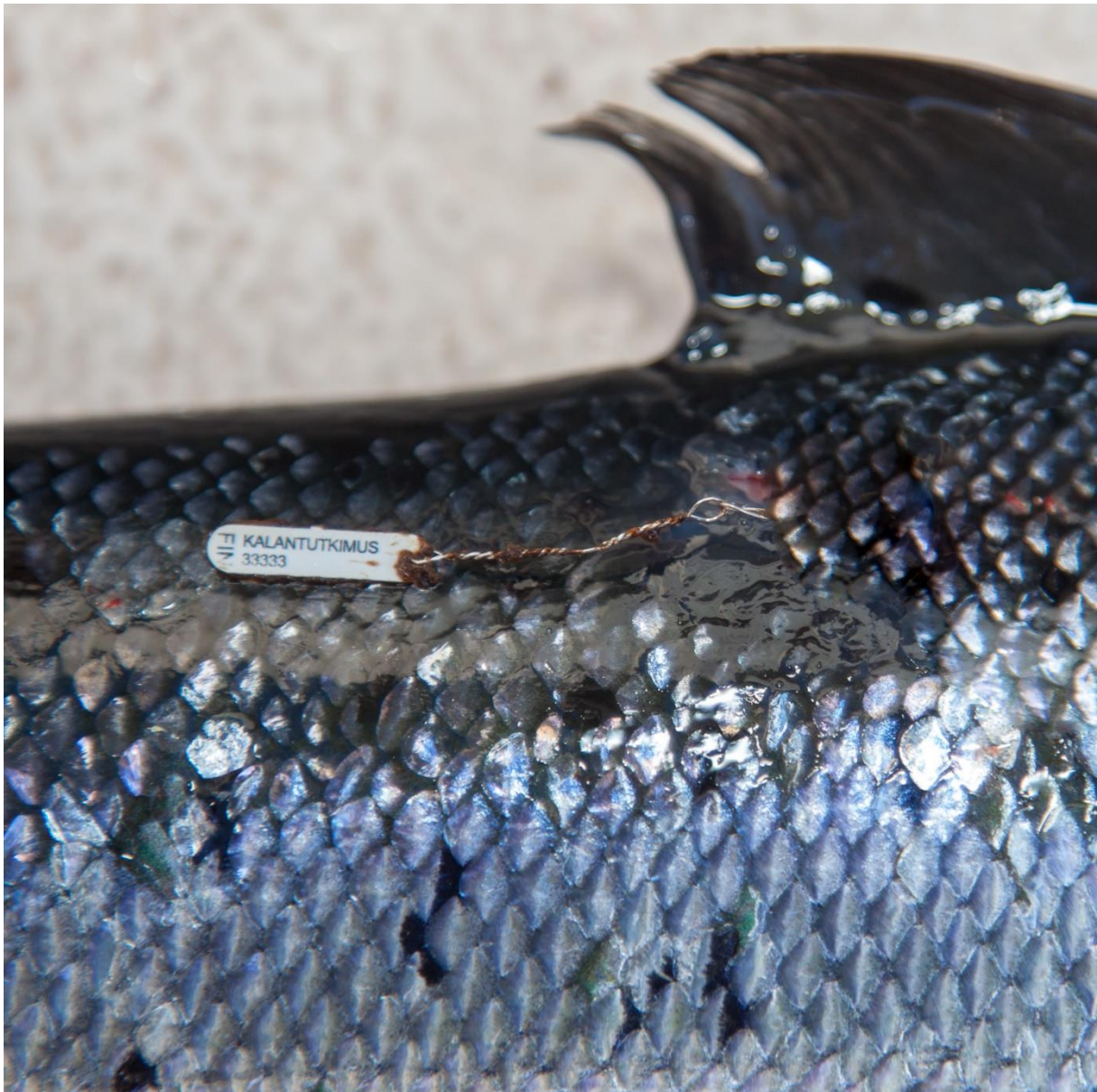
Die Lachse in der Ostsee legen in ihrem Leben weite Wanderungen zurück und die Bestände einzelner Flussgebietseinheiten vermischen sich im Meer. Dieser markierte Lachs aus Finnland wurde im Frühjahr vor Rügen gefangen.