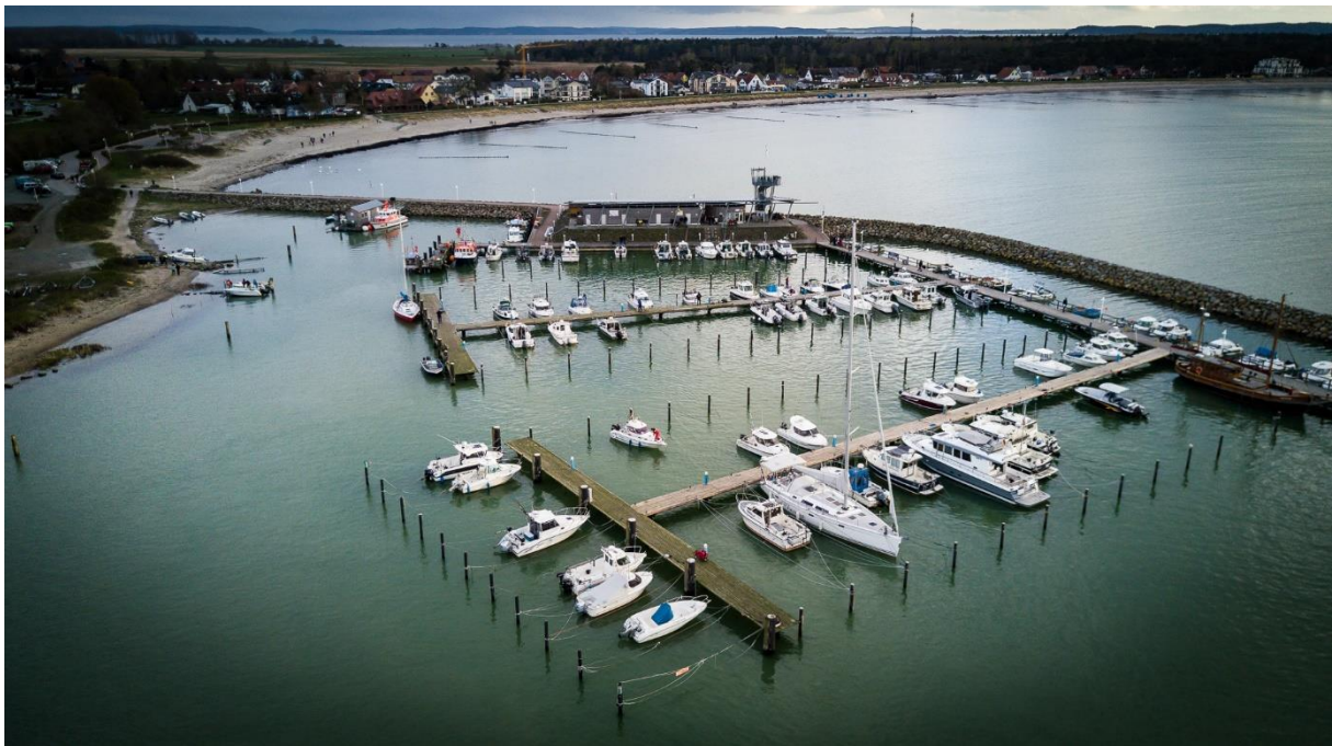
Angelboote im Hafen von Glowe auf Rügen. Die Angelfischerei ist ein wichtiger Sektor für Einkommen und Arbeitsplätze in den Küstengemeinden.

Neben der sozialen Bedeutung des Engagements von Anglern ist auch die wirtschaftliche Komponente der Freizeitfischerei auf Lachs in der Ostsee von großer Bedeutung. Die Schleppangelfischerei ist ein wichtiger Sektor für Einkommen und Arbeitsplätze in den Küstengemeinden. Untersuchungen des Thünen-Instituts für Ostseefischerei (2022 2 ) haben ergeben, dass Lachsangler allein in Deutschland pro Person und Jahr etwa 2.750 € im Rahmen der Angelei ausgeben. Dies entspricht Gesamtausgaben von 5 Millionen € oder 1.000 € pro entnommenem Lachs. Eine Erhebung des finnischen Verbands für Freizeitfischerei zeigt ähnliche Ergebnisse mit Direktinvestitionen von 3.461 € pro Trolling-Boot bei Kosten von 1.081 € pro angelandetem Lachs (Rautanen, 2018 3 ). Die EAA ist der Ansicht, dass die Meeresfischerei auf Ostseelachs bei entsprechender Regulierung minimale Auswirkungen auf die Flussbestände hat. Gleichzeitig bleiben die Angelmöglichkeiten sowie die damit verbundenen regionalen Aktivitäten erhalten.